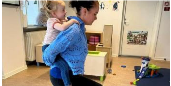
Så trænes der - og børnene elsker det!

kan være en del af. Det er vigtigt, at det er øvelser, som alle får noget ud af og som kan bidrage til at reducere fysiske gener, der på sigt ellers kan udvikle sig til større skavanker.