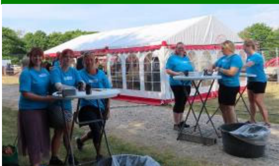
Lidt billeder fra årets sommerfest