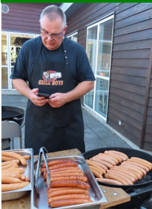
Fra Fællesspisning i august