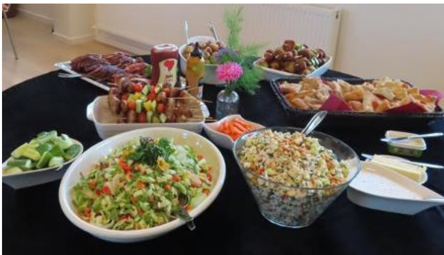
Fra Frivilligfesten 2023