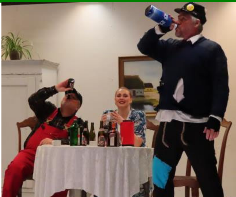
Fra årets dilettant